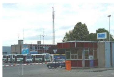
Le tramway roule et c'est donc plus de bus disponibles pour Rixheim et ailleurs...