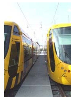
Le tramway « libère » les bus...