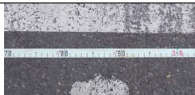
Axe médian à 2,86 m