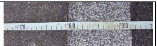
5.79 m (coté collines)