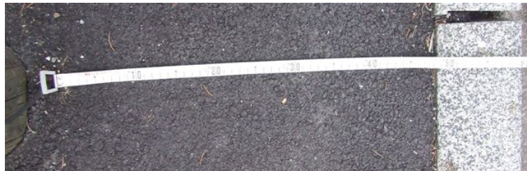
▲ A une dizaine de mètres du lampadaire se trouve un poteau en bois. A cet endroit la largeur réelle à partir du fil sortant du sol et la bande de roulement est de 60 cm.