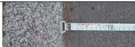
0,00 m (coté voie ferrée)

Afin d'avoir une largeur de trottoir suffisante pour une poussette ou un fauteuil roulant ( 95 cm au minimum), la largeur de la bande de circulation / roulement devait être réduite à 5,40 m.( M.Isselin de la Municipalité Hanser parlait de 5,00 m). Or, les mesures prises le 28.02.2008 montrent une largeur de 5,79 m, prouvant hélas que M. Hanser (qui est aussi président du SIRHIS), n'a rien fait pour suivre et défendre cette modification destinée à plus de sécurité des piétons.