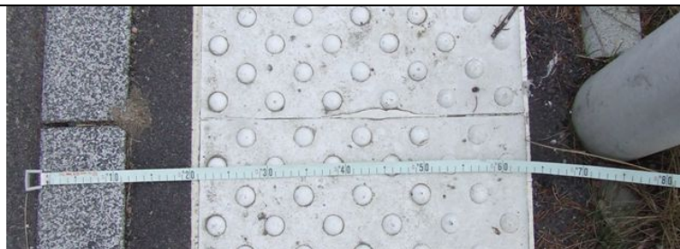
▲ La largeur du trottoir au niveau du « fameux » lampadaire est de 69 cm.