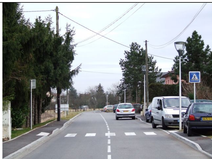
La rue des Pierres rénovée avec ses poteaux, ses câbles et ses lampadaires mal placés. C'est la gestion Hanser...

Pour éviter cette erreur il aurait fallu soit rétrécir la bande de roulement soit faire l'acquisition d'une bande de terrain de 50 cm de large (champs).